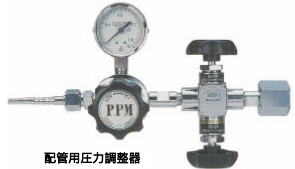
配管用圧力調整器