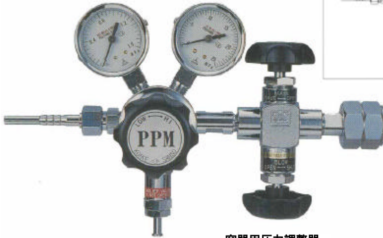
容器用圧力調整器