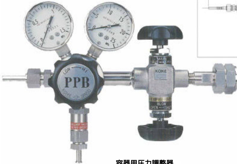
容器用圧力調整器