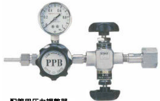
配管用圧力調整器